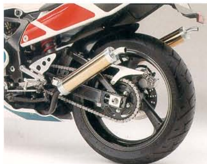
▲カラー圧入タイプホイール