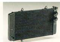
▲ダブルコアラジエーター