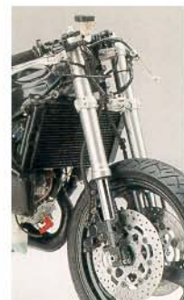
▲減衰力調節機構付フロントフォーク