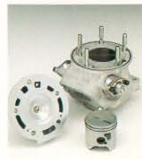
▲専用設計ボディシリンダーヘッドシリンダー、ピストン