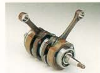
▲専用設計クラック