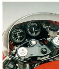
▲分離式スピードメーター