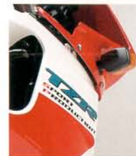
▲クイックファスナー式アンダーカウル