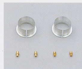
'91-'92車輛用 リストリクターセット ('93レギュレーション対応パーツ) セット希望小売価格 ¥8,300